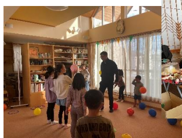
12/16 子どもクリスマス会